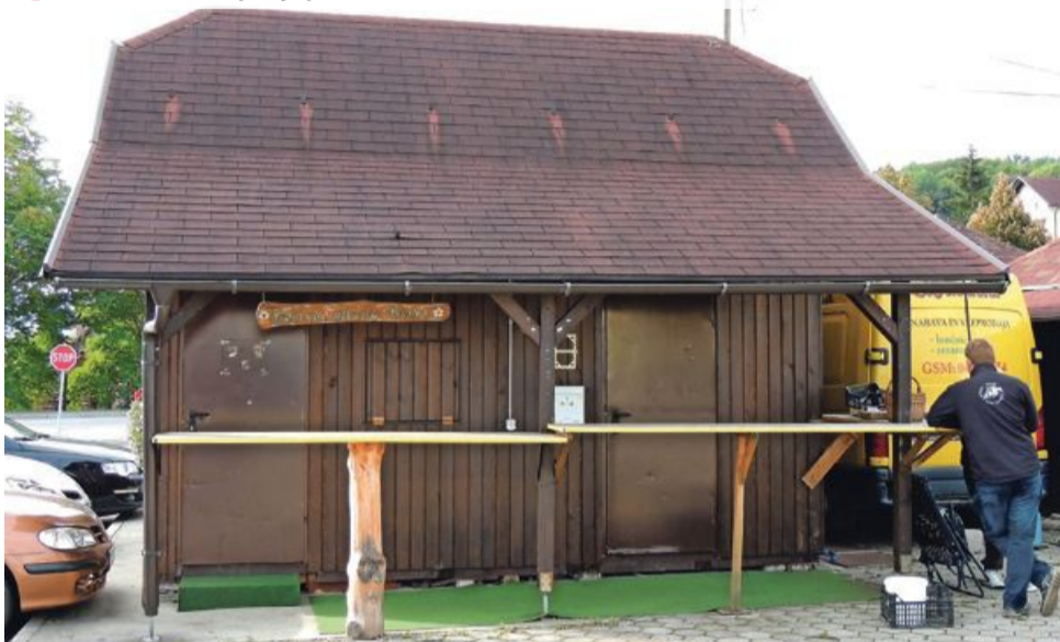
1 Izhodišče krožne poti je pri hišici TD Pesnica na sadni tržnici.

Flac (Pesniški Dvor 13A, 051-237-823, www.happyfarm.si). »Na ekološko zaščitem posestvu z 20 hektari pašnikov in 17 hektari gozda se ukvarjamo s šolo jahanja in terapevtskim jahanjem za odrasle in otroke. Pri tem je jahanje možno v peščeni in travnatih maneži s parkurjem ali na terenu. Poleg konj imamo še dva ponija ter domače živali (koze, mačke, kunce, kokoši, račke), tako da lahko pri nas vsa družina preživi prijetne ure v naravnem okolju.«